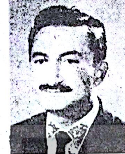
Ecevit: Hatadan dönmek var!

tırafını yapıyor, «Çok kötü ve müşkül durumdayız. Devrimci sendikalar bizlere nazaran daha mükemmel sözleşme imzalamaktadırlar. Biz patronlara has kı yapamıyor, binaenaleyh de u-