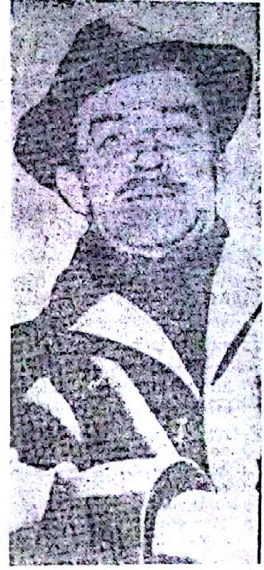
Romancı Orhan Kemal.

Eserlerinde çoğunlukla emekçinin dert ve sorunlarını usta kalemiyle işleyen, onun uyanıp bilinçlenmesine büyük katkıları bulunan değerli romancı, hikâyeci ve şair Orhan Kemal, 3 Haziran 1970 günü tedav için gittiği Sofyada vefat etmiştir. Ünlü romancının bu beklenmedik andaki ölümü tüm Türk halkı arasında üzüntüyle karşılanmıştı.