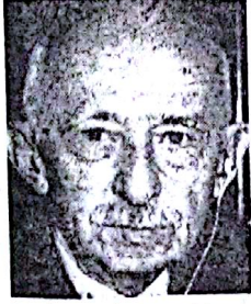
İnönü: İşçiler haklı

Sendika ağaları bütün yalan ve dümenlerini yitirmiş, uyanan bilipçilen emekçiler karşısında üzgün kalmışlardır. Foy-